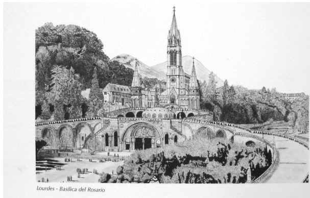
Lourdes - Basilica del Rosario

per TUTTI + i nuovi soci, ore 20.45 sabato 22 agosto, ore 20.45, SEDE: Mandato Unitalsi